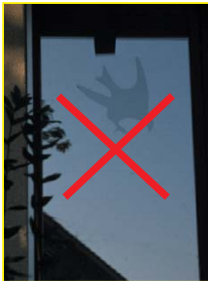
Inapproprié : les silhouettes noires sont inefficaces car elles ne sont pas assez visibles.