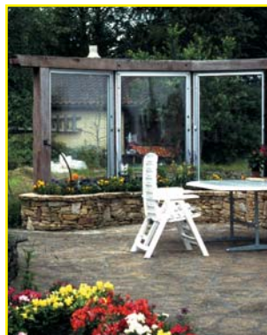
Protection contre le vent