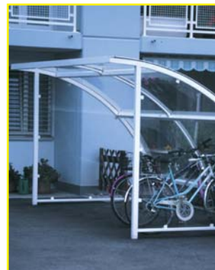
Garage à vélo