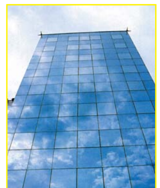
Façade fortement réfléchissante