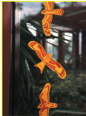
Efficacité limitée : les silhouettes de couleur offrent une protection limitée mais il faut en coller plusieurs sur chaque vitre.