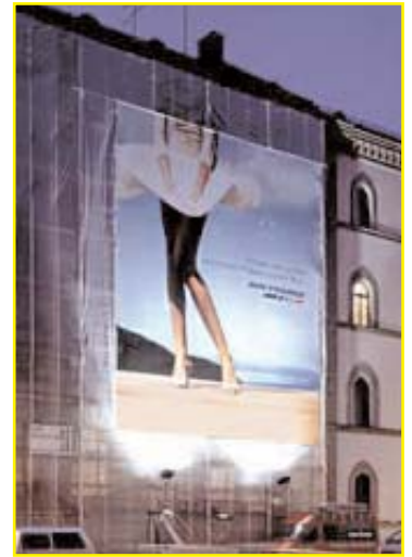
Les posters publicitaires géants appelés Blowups apportent une bonne protection aux façades de verre de grande taille.

Il est plus facile de traiter le verre à l'atelier, avant le montage (p. ex. verre gravé, dépoli, émaillé). S'il est nécessaire d'agir ultérieurement, on peut coller des bandes autocollantes ou des décorations de différentes qualités provenant de magasins spécialisés. Pour des solutions durables, on choisira des produits de haute qualité destinés à une utilisation externe. La Station ornithologique vend les silhouettes jaunes-rouges (set de 6 pièces à Fr. 10.-), l'Association suisse pour la protection des oiseaux vend des rouleaux de bandes adhésives (10 m à Fr. 10.-).