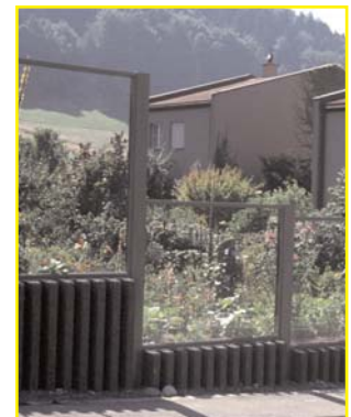
Protection contre le bruit