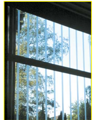
Pour un usage professionnel : les produits Scotchcal de 3M collent longtemps et existent en différentes couleurs.

Astuce : coller les silhouettes et les bandes autocollantes sur des vitres propres. Pour éviter les bulles, humidifier la vitre et passer sur les bandes avec une spatule de cuisine. Pour enlever les anciennes bandes, les chauffer brièvement à l'aide d'un sèche-cheveux.