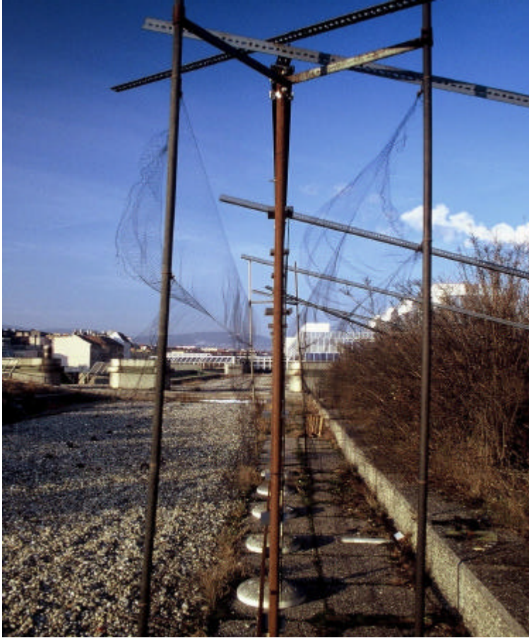
Abb. 2: Versuchsanlage von der Seite um die vor und hinter der Glaswand gespannten Japannetze zu zeigen