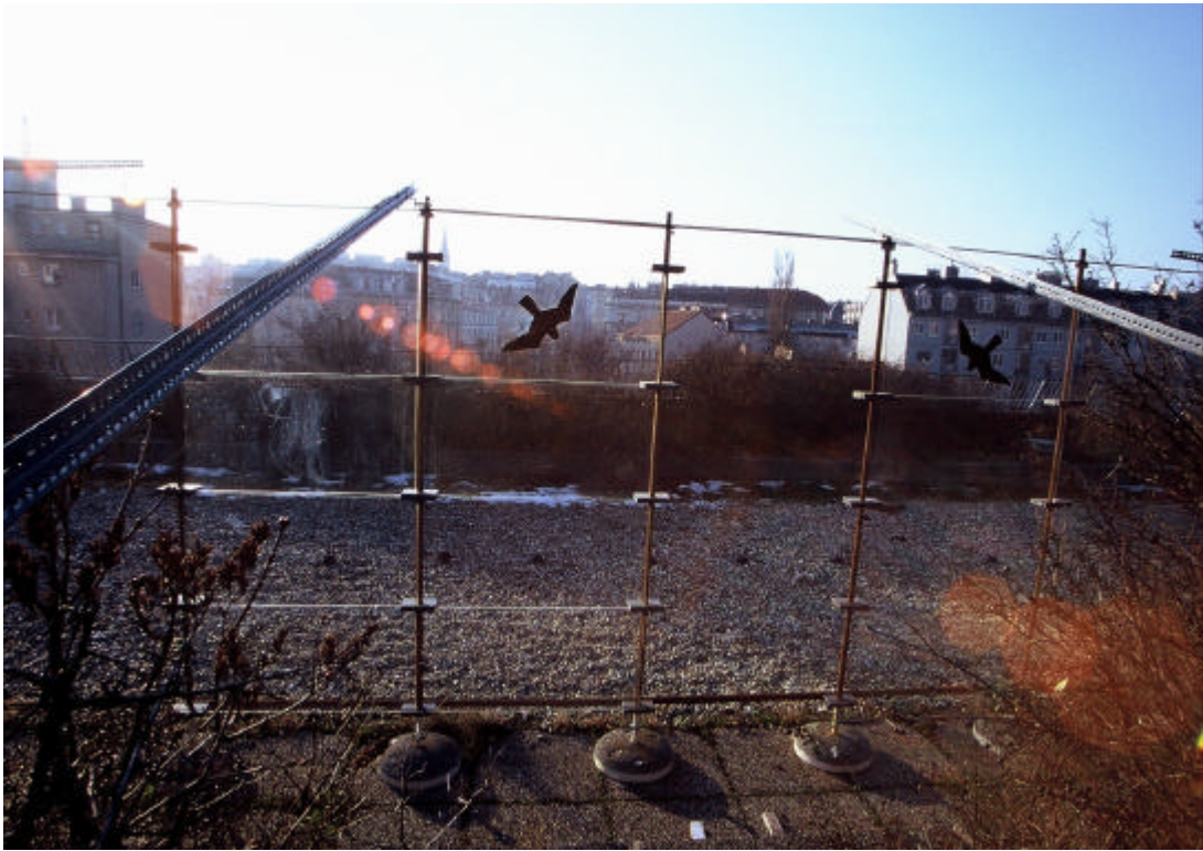
Abb. 5: Blick durch die Glaswand vom Gebäude weg