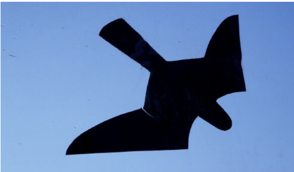
Abb. 3: Verwendete Greifvogelsilhouette