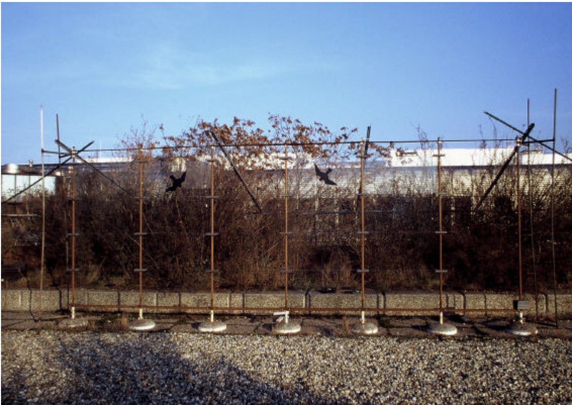
Abb. 4: Blick durch die Glaswand zum Gebäude

Die Versuchsanlage wurde auf der Außenterrasse (Ebene 3) des Institutes für Zoologie, Althanstrasse 14 1090 Wien, zwischen Spange 2 und 3 aufgestellt. (siehe Abb. 1) Direkt am Gebäude befindet sich dort eine Terrasse mit einigen Büschen auf gleicher Ebene. Darauf folgt ein Innenhof, welcher zwei Ebenen tiefer liegt (Ebene 1). In diesem Innenhof befindet sich ein großer Baum, der über die Ebene 3 hinausragt. Nach diesem Innenhof folgt die erste Buschreihe auf Ebene 3, hinter der sich die Glaswand befindet. Danach erstreckt sich eine ca. 5 m breite Kiesterrasse, auf welche die zweite Buschreihe folgt. An das Gebäude schließt dann noch ein kleiner Park mit einigen Bäumen und Gebüsch an. (siehe Abbildung 6 im Anhang) Blickt man durch die Glaswand zum Gebäude, ist direkt dahinter eine Buschreihe und eine Baumkrone zu sehen. (siehe Abb. 4) Blickt man andererseits von der Gebäudeseite durch die Wand, liegt dahinter die ca. 5 m breite Kiesterrasse und danach die andere Buschreihe. (siehe Abb. 5) Der Park neben dem Gebäude ist von hier aus nicht zu sehen. Die Anlage simuliert die Situation einer Glaswand.