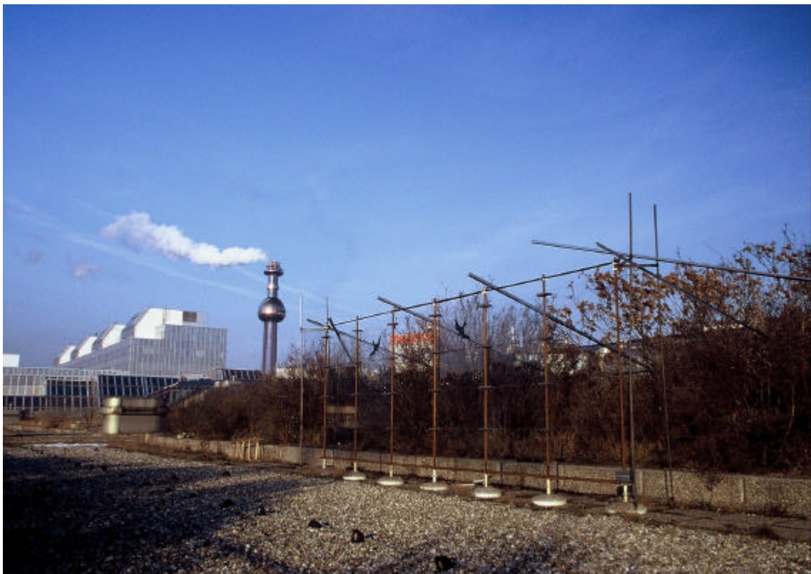
Abb.1: Versuchsglaswand auf der Dachterrasse des Inst. f. Zoologie der Universität Wien

Die Versuchsanlage der Studie besteht aus 7 ca. 2,3 m hohen Metallstützen, zwischen denen in den 6 Zwischenräumen (Spalten 1 bis 6) jeweils 4 Glasscheiben von 100 cm Breite, 50 cm Höhe und 5 mm Dicke übereinander eingespannt werden können. (siehe Abb. 1) Insgesamt kann so eine 6 m breite und 2 m hohe Glaswand eingerichtet werden. Für die vorliegende Untersuchung wurden jedoch nur 4 dieser 6 Spalten mit Glasscheiben bespannt. In zwei dieser 4 bespannten Spalten war jeweils auf die oberste Scheibe eine Greifvogelsilhouette geklebt. (siehe Abb. 3) Ca. 30 cm vor und hinter der Glaswand war ein 6,5 m langes Japannetz auf 2 m Höhe gespannt. (siehe Abb. 2) Diese Netze bestehen aus 4 übereinanderliegenden Fangtaschen, die sich in der Höhe jeweils mit einem Scheibenfeld decken. So kann jeder gefangene Vogel genau einem Feld der Glaswand zugeordnet werden.