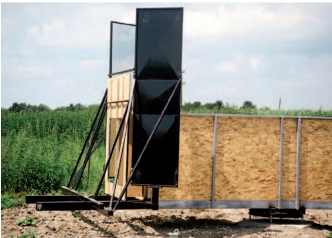
■ Abbildung 4:

Der unschlagbare Vorteil der Flugtunnel-Versuche ist ihre hohe Standardisierbarkeit. Vögel werden unter kontrollierten Bedingungen und in identischem Verhaltenskontext eingesetzt. Der apparative Aufbau einer jeden Anlage liefert vergleichbare Bedingungen hinsichtlich der Glasscheiben, ihrer Beleuchtung, des Hinter-