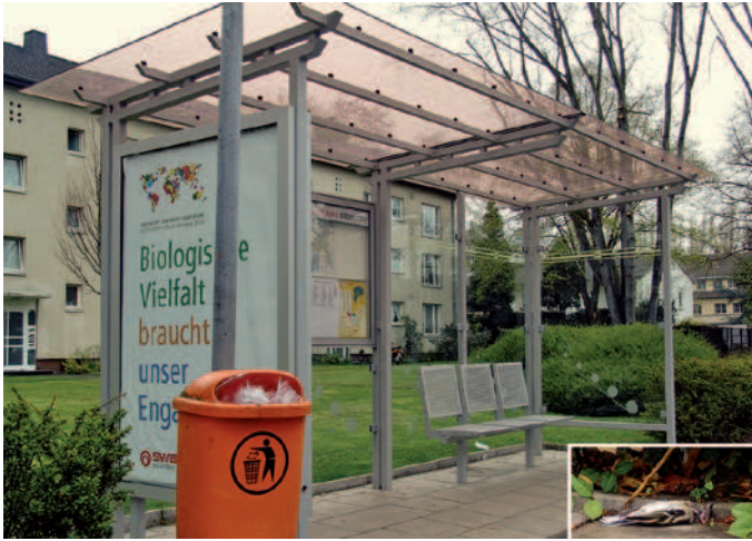
■ Abbildung 1:

Durchsichtige Scheiben als tödliche Gefahr für Vögel. Allein in Bonn summieren sich die Scheiben von Fahrgastunterständen im öffentlichen Nahverkehr auf ca. 1,5 Kilometer Länge. Wirksame sichtbare Markierungen wären möglich, ohne Ästhetik oder Sicherheitsbedürfnisse zu beeinträchtigen. - Clear panes can be fatal for birds. Just in the municipal area of Bonn, glass panes from passenger shelters for public local traffic add up to about 1.5 kilometres in length. Effective visible markings would be applicable without compromising aesthetics or safety demands.