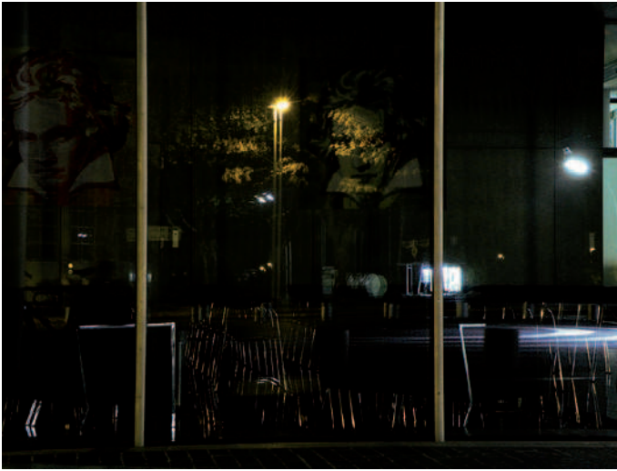
■ Abbildung 8:

Nächtliche Spiegelung, auch eine Quelle für Vogelschlag? Die physiologische Forschung wirft zahlreiche Fragen auf, die die Wirksamkeit ultravioletter Markierungen gegen Vogelschlag schon tagsüber in Zweifel ziehen. - Specular reflection by night, also responsible for bird strikes? Physiological research raises numerous questions casting doubts on the efficacy of ultraviolet markings against collisions even in daylight.