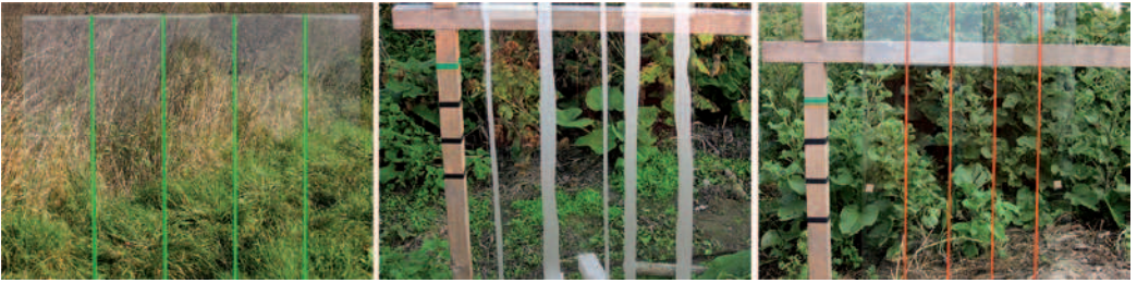
■ Abbildung 7:

Sichtbare Markierungen, die im Flugtunnel von RÖSSLER getestet wurden. Von links nach rechts: 10v grün 0,5mm; Glasdekor 25; 10v Orange vertikal. Zu den Ergebnissen s. Abb. 5. – Visible markings with test results available from RÖSSLER'S flight tunnel. From left to right: 10v green 0.5 mm; glass 25; 10v orange vertical. For the results cf. fig. 5.