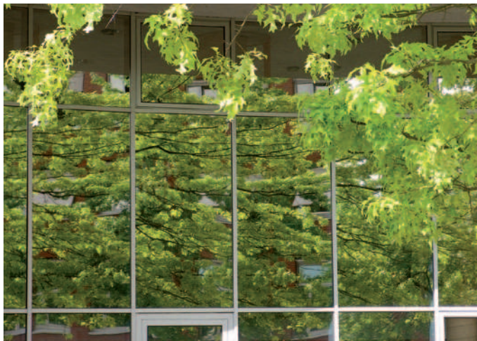
■ Abbildung 2:

REGNER 2002, REGNER 2003). Kurz darauf nahm sich ein Glashersteller dankenswerter Weise dieser Frage an. Die Firma Arnold Glas im württembergischen Remshalden ist derzeit weltweit das einzige Unternehmen, das Flachglas mit UV-optischen Eigenschaften aus Gründen des Vogelschutzes anbietet (KLEM in litt. 2011). Als jedoch nacheinander verschiedene „UV-Gläser“